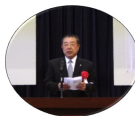
虻名 鈺治・東北町長